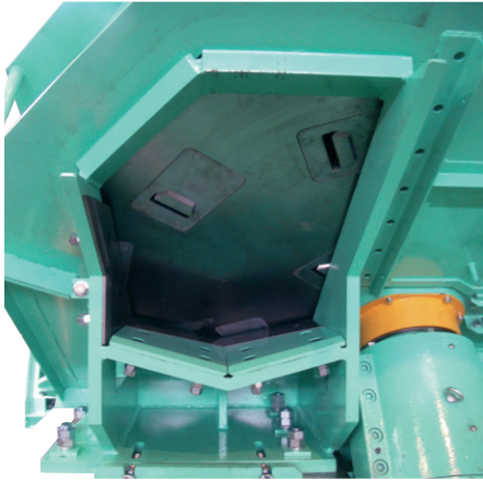
▲ 広いディスク面にスパイラル状に分散している切刃